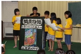
久々のジャンボ絵本