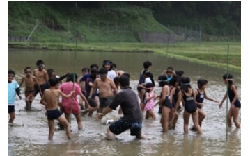
どろんこサッカー