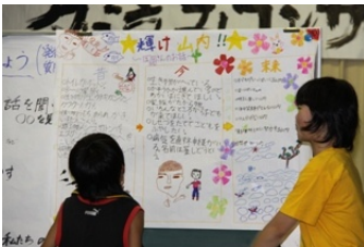
聞き取りをまとめています