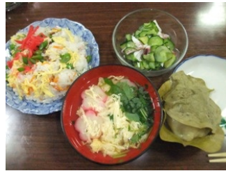
ボランティアさんによる美味しい食事