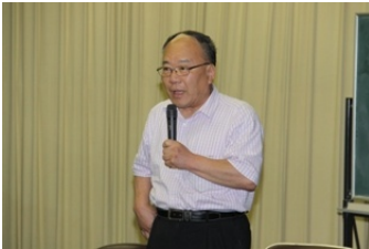
金井教授がコメント