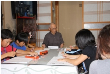
名人への聞き取り(山内の今昔と未来像)

特に山内探検では5つのグループに分かれた、山内の暮らしの今昔を聞き取りました。この聞き取り【聞き書き】は、今後ますます重要になってくるとのことです。違った目線から見ること、普段気付かない良さを発見できます。今回のプロジェクトについて、多くのボランティアさんが関わっていただきました。本当にありがとうございました。